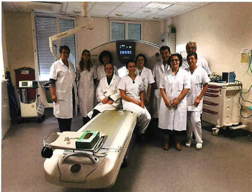
Les équipes du service d'imagerie médicale.

En attente depuis 2009, c'est en septembre 2015 que le scanner de Gourdon a été mis en place et a vu son premier patient. Un scanner doté d'une gestion fine des dosages de radiation permettant d'adapter les protocoles en fonction du patient. Bilan et perspective de ce service.